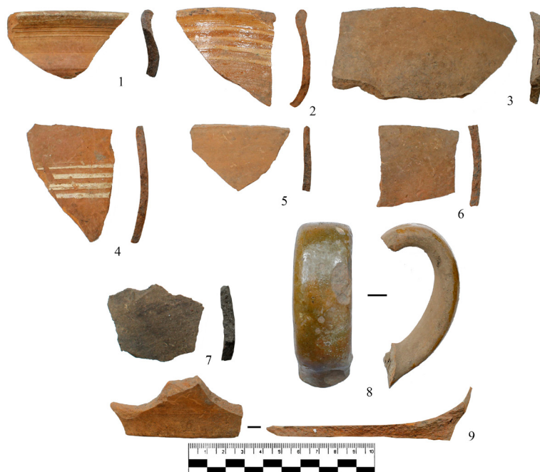
Рис. 4. Город Бирск. ОКН «Старый Бирск, исторический культурный слой и могильник». Шурф №1. Фрагменты гончарных сосудов: 1–5 – венчики; 6 – придонная часть. 6 – горизонт 2; 1 – горизонт 3; 2–4 – горизонт 4; 5 – подъемный материал

Исследования 2022 г. актуализировали проблему установления границ ОАН «Старый Бирск, исторический культурный слой и могильник» на основе архивных материалов для дальнейшего его сохранения и перспективного археологического изучения территории так называемого посада XVII–XVIII вв.