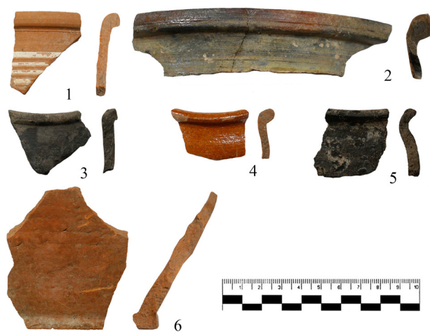
Рис. 3. Город Бирск. ОКН «Старый Бирск, исторический культурный слой и могильник». Шурф №1. Горизонт 2. Фрагменты гончарных сосудов. 1, 2 – венчики; 3–7 – стенки; 8 – ручка; 9 – днище

Выявленные на территории Бирска находки свидетельствуют о сохранности культурного слоя, особенно его раннего этапа. Незначительное проникновение разновременных находок, вплоть до горизонта 4, свидетельствует лишь о частичной переотложенности слоя. Из индивидуальных находок в шурфе зафиксированы монета 1938 г.,