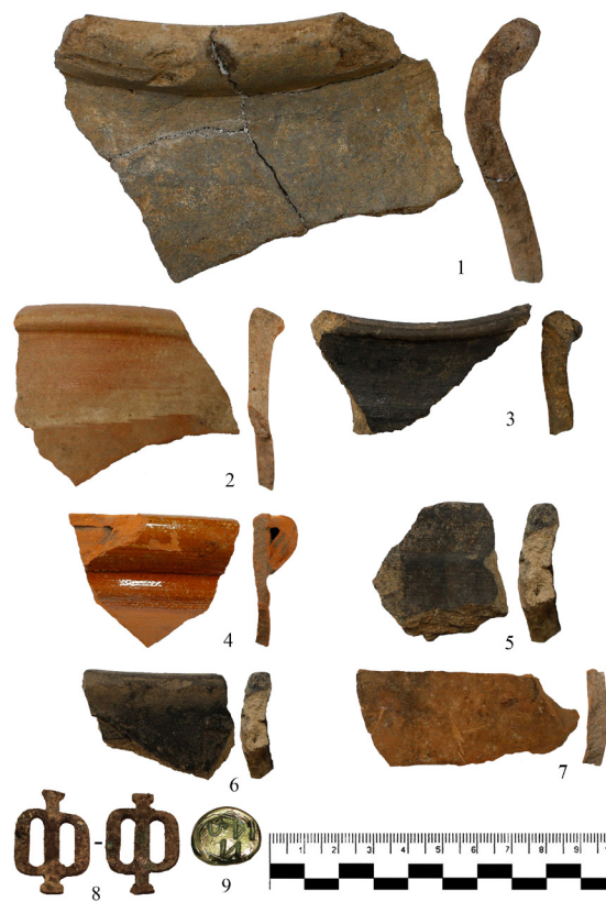
Рис. 2. Город Уфа. ОКН «Культурный слой г. Уфы кон. XVIII – нач. XX вв. на ул. Сочинская, 29». Фрагменты гончарных сосудов

В ходе исследований удалось заложить один разведочный шурф в огороде нежилого дома, расположенного в 11 м от створа ул. Ленина. Культурный слой в нижних горизонтах оказался практически непогрязенным, что позволило определить