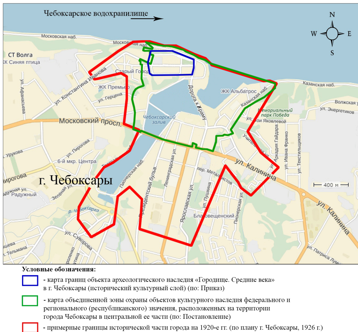
Рис. 2. Схема границ ОАН «Городище. Средние века», объединенной зоны охраны ОКН в центральной части г. Чебоксары и границ исторической части города на 1920-е гг.

До 1966 г. в Чебоксарах не проводилось специальных археологических исследований. Велись наблюдения за земляными работами, отдельные находки попадали в фонд Чувашского краеведческого музея. Тем не менее, уже по этим предварительным данным П.Н. Третьяков и А.П. Смирнов отмечали наличие в Чебоксарах мощного культурного слоя. В 1966 и 1968 гг. Поволжской археологической экспедицией началось археологическое изучение Чебоксар, в 1969–1972 гг. город исследовался Чувашской археологической экспедицией, в 1979 и 1980 гг. – Чебоксарской археологической экспедицией (Ю.А. Краснов, В.Ф. Каховский, И.С. Вайнер, Б.В. Каховский). Заказчиками этих