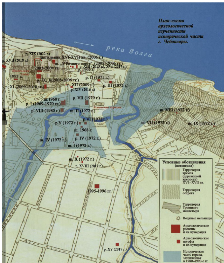
Рис. 3. Схема археологической изученности исторической части г. Чебоксары с указанием мест раскопов и шурфов 1966–2022 гг. (по: [Старые Чебоксары..., 2012] с уточнениями автора) Fig. 3. Layout of the exploration degree of the historical part of Cheboksary illustrating sites of excavations and pitting in 1966–2022 (acc. to: [Old Cheboksary..., 2012] with the author's specifications)