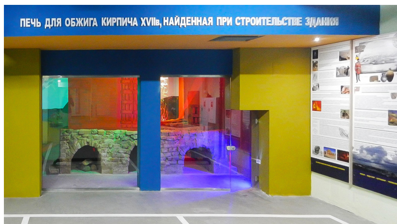
Рис. 6. Экспозиция в подземной парковке Делового центра «Республика» с печью для обжига кирпича XVII–XVIII вв., найденной при строительстве соседнего здания (авт. Д.Ф. Мадуров).

4. Единственным существующим примером внедрения (инвенции) археологических объектов в историко-культурную и архитектурно-художественную среду Чебоксар на сегодняшний день является небольшая музейная экспозиция на подземной парковке делового центра «Республика», посвященная обнаруженной на месте строительства соседнего здания печи XVII–XVIII вв. для обжига кирпича (раскопки Д.В. Спрыжкова, 2017 г.) (рис. 6). Несмотря на ее небольшой размер и неудачное расположение, она неизменно привлекает интерес и внимание туристов и общественности. Однако, к сожалению, о существовании данной экспозиции мало кто знает.