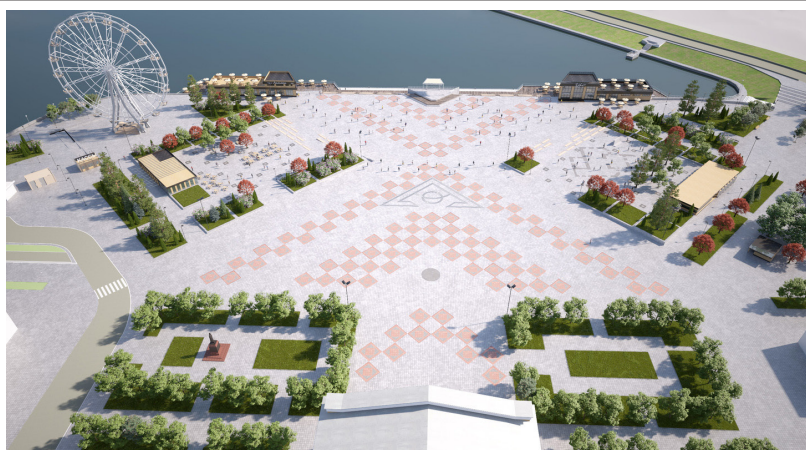
Рис. 5. План реконструкции Красной площади 2019 г. в г. Чебоксары с обозначением контуров разрушенной Благовещенской церкви (по: Реконструкция Красной площади и чебоксарского залива (2019–2021) // https://forum.na-svyazi.ru/?showtopic=2811617&st=180 )

Fig. 5. Layout of the Red Square Restoration in 2019 in Cheboksary illustrating outlines of the destroyed Annunciation Church (acc. to: Restoration of the Red Square and Cheboksary Bay (2019–2021) // https://forum.na-svyazi.ru/?showtopic=2811617&st=180 )