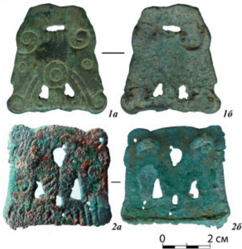
Рис. 1. Зооморфные нашивки: 1 – Кипчаковское городище, подъемный материал; 2 – Шиповский могильник, группа курганов III, раскоп I, погребение 5.